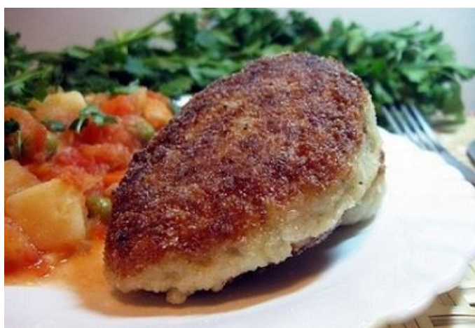
Рисунок 1 Котлета рыбная

Если иллюстрация размещается на листе формата А4, то она располагается по тексту документа сразу после первой ссылки по окончании